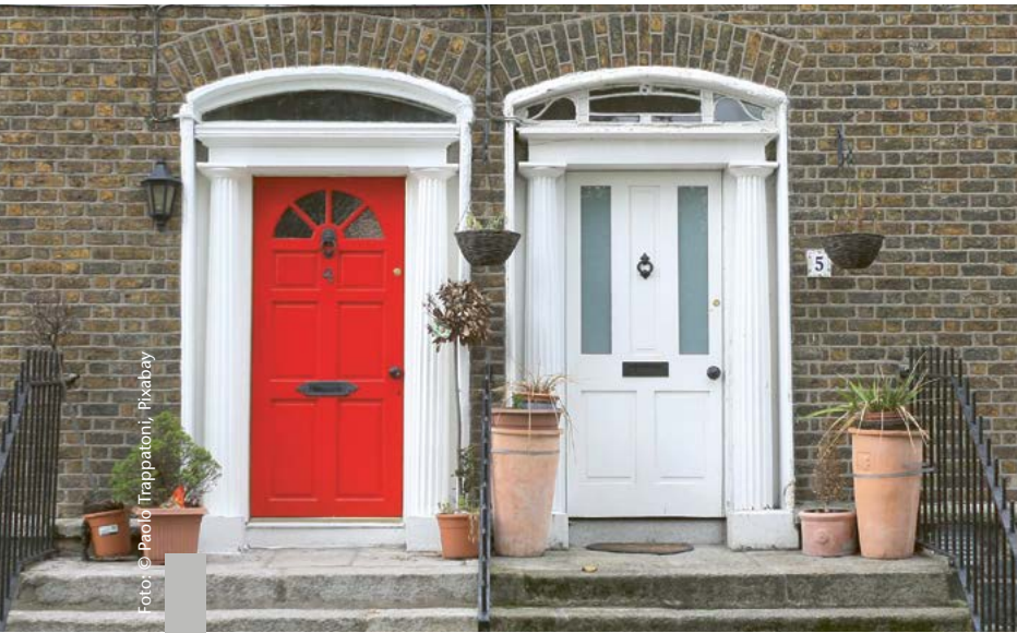
Wer den Verkaufspreis geschickt verhandelt, kann viel gewinnen.

Wer die richtige Immobilie gefunden hat, ist seinem Ziel einen großen Schritt näher gekommen. Jetzt beginnen die Verkaufsverhandlungen. Zu Beginn empfiehlt es sich, die wichtigsten Eckdaten auf ihre Richtigkeit zu überprüfen. Stimmt die Wohnfläche? Wie sieht es mit der Energieeffizienz aus? Sind alle Umbauten, z.B. eine Einliegerwohnung, genehmigt? Um erfolgreich verhandeln zu können, sollten sich Kaufinteressenten einen Überblick über die Anzahl der Mitbewerber verschaffen. Je mehr Mitbewerber es gibt, desto riskanter werden die Preisverhandlungen. Beim Verkauf über einen Makler ist mit einer größeren Anzahl von Mitbewerbern zu rechnen. Bei Privatverkäufen können auch die Gründe für den Verkauf einen Hinweis auf den Verhandlungsspielraum geben. Für den Preis einer Immobilie sind auch folgende Fragen entscheidend: Wie gut ist die Infrastruktur, z.B. öffentliche Verkehrsmittel, Einkaufsmöglichkeiten, Schulen, Ärzte? Verfügt die Immobilie über die übliche Ausstattung, z.B. Einbauküche, Balkon, Stellplatz? Gibt es ein Verkehrswertgutachten, Marktanalysen oder Vergleichswerte, an denen man sich orientieren kann?