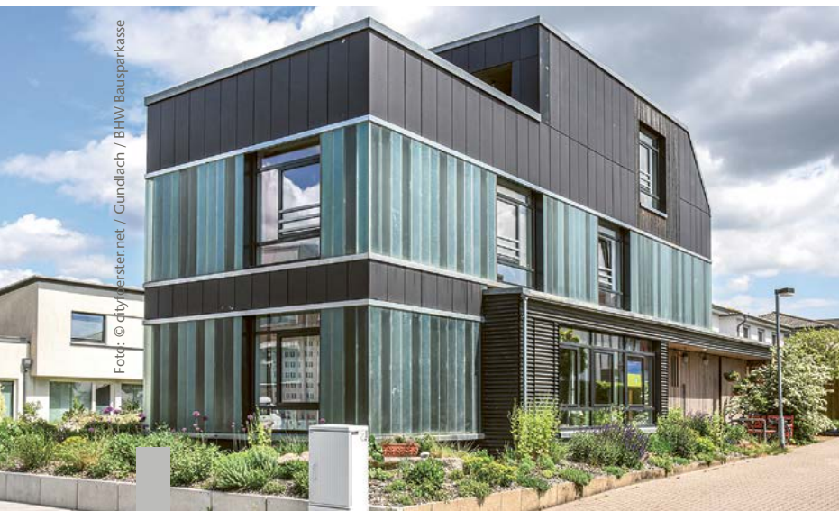
Dieses Haus in Hannover besteht komplett aus recycelten Materialien.

Klinker aus alten Dachziegeln, Fußböden aus aufbereitetem Altholz, Markisen und Rollos aus alten PET-Flaschen – der Markt für Recyclingprodukte boomt. Beim Bauen und Modernisieren gibt es bereits ein breites Angebot im Fach- und Onlinehandel. Was alles möglich ist, zeigt das Recyclinghaus in Hannover. Erstmals in Deutschland besteht ein Einfamilienhaus vollständig aus wiederverwendeten oder recycelten Baustoffen. Für die Fassade wurden gebrauchte Faserzementplatten und Holzlatten alter Saunabänke verwendet, für den Terrazzoboden alte Ziegelsteine. Die Fenster stammen aus dem Abbruch eines ehemaligen Fabrikgebäudes.