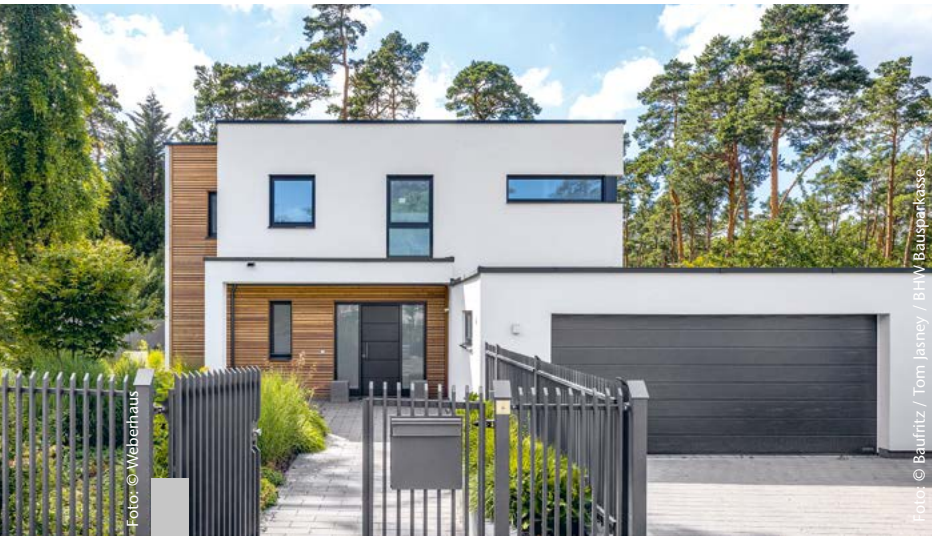
Ob Tiny House, Ein- oder Mehrfamilienhaus – industriell und seriell vorgefertigte Bauelemente vereinfachen, beschleunigen und verbilligen das Bauen.

Das Image von Fertighäusern hat sich deutlich gewandelt. Heute gilt das Prinzip der Vorfertigung als Schlüssel für eine intelligente Bauweise, die Ressourcen schon und viele Vorteile bietet. Vom Tiny House bis zum Bungalow wird serielles Bauen immer vielseitiger. Einer der Vorläufer des modernen Fertighauses ist das Fachwerkhaus. Die in der Werkstatt vorgefertigten Holzbalken wurden traditionell auf der Baustelle montiert und mit Lehm und Ziegeln ausgefacht. Heute werden Fertighäuser industriell vorgefertigt, das macht ihren Bau schnell und variantenreich. Ihre früher oft beanstandete Gleichförmigkeit ist individuellen Gestaltungen gewichen.